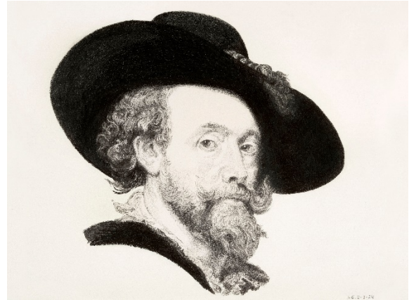
Arcangela Paladini Peter Paul Rubens