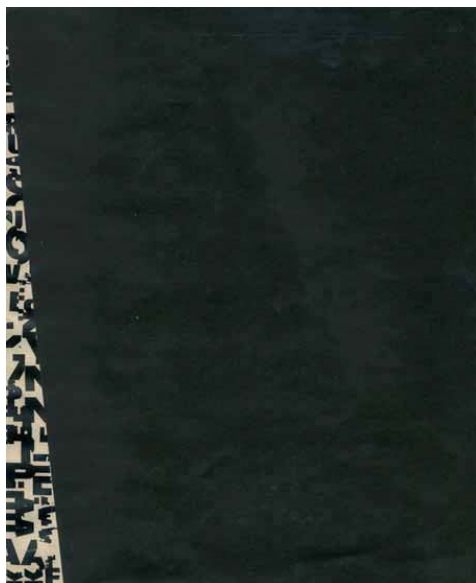
Ignacio Gómez de Liaño. Sin título. c. 1966. Collage sobre cartulina. 40 x 34 cm